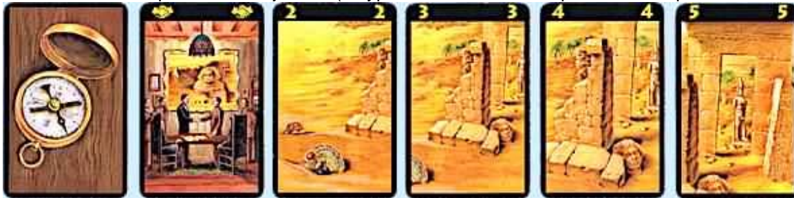
dos des 60 cartes

Ci dessous l'exemple des carte jaunes (le type de carte est identique dans chaque couleur, seul les dessins changent)