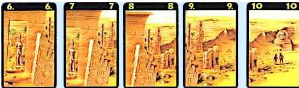
8 carte expéditions numéroté de 2 à 10