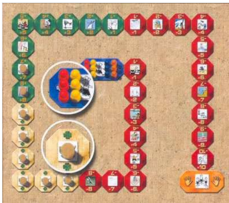
La mise en place

On place les tuiles côte à côte comme sur le schéma suivant :